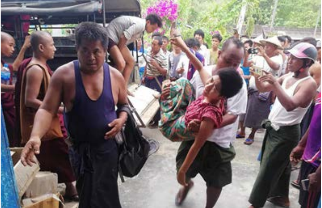
စပါးထားကျေးရွာမှ ဒဏ်ရာရရှိသူများအား မင်းပြားဆေးရုံသို့ သယ်ဆောင်လာစဉ်။

“လက်နက်ကြီးက မြောင်းတွေဘက်ကလာတယ်။ ပြီးတော့ တစ်ခါတည်း ‘ရိုင်း’ ဆိုပြီးတော့ ပေါက်ကွဲသွားတာ။ ပေါက်ကွဲတော့ အမျိုးသမီးတွေ ငိုကြတယ်။ သေသူသေ၊ ဒဏ်ရာရသူရ ဖြစ်သွားတယ်” ဟု ကျေးရွာအုပ်ချုပ်ရေးမှူး