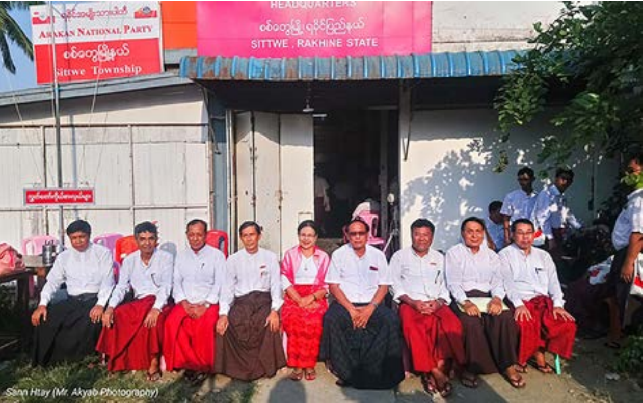
ရခိုင်အမျိုးသားပါတီ မူဝါဒရေးရာဦးဆောင်ကော်မတီဝင်များအား တွေ့ရစဉ်။