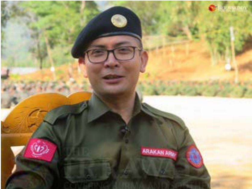
AA စစ်ဦးစီးချုပ် ဗိုလ်ချုပ်ထွန်းမြတ်နိုင်

ဗိုလ်ကြီးအဆင့်ရှိသူ တဦးသည်ပင် ထွက်ပြေးလို့ ပြန်ဖမ်းမိတာမျိုး ဖြစ်ခဲ့ဖူးကြောင်းလည်း သူကပြောပြတယ်။ KIA ထုတ်ပေးထားတာက ရဲဘော် ၂၆ ယောက်စာ၊ တကယ်တမ်း AA မှာ ရှိနေတာက လူ ၅၀၊ ဒီလိုနဲ့ စားရေးသောက်ရေး ကျပ်တည်းလာပြီး မလောက်မငှတွေ ဖြစ်လာကြတယ်လို့ ဆိုပါတယ်။ ကချင်လူမျိုးတွေအတွက် ထမင်းပြိန်စေလို့ မက်မက်မောမော စားကြတဲ့ အရ