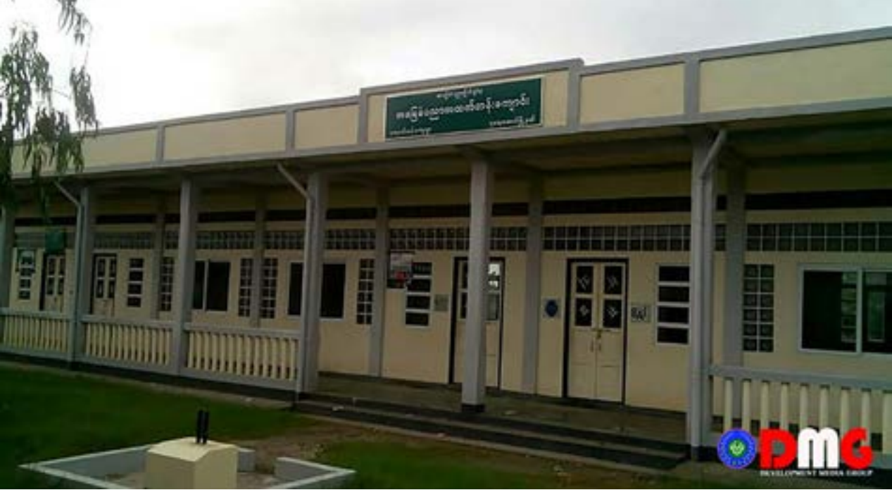
အခြေခံပညာအထက်တန်းကျောင်း၊ ကျောက်တန်းကျေးရွာ၊ ရသေ့တောင်မြို့နယ်။

“ကျောင်းအပ်နှံတဲ့ ကျောင်းသူ၊ ကျောင်းသား ဦးရေ ၂၀၀ ကျော်ပဲ ရှိသေးတယ်။ ရွာမှာလည်း ပြန်လာတဲ့သူတွေ နည်းနေသေးတယ်။ အခုရက်ပိုင်း ပစ်ခတ်သံတွေကြားလို့ နီးစပ်ရာကျေးရွာတွေကို ပြန်ထွက်ပြေးသွားကြတဲ့ မိသားစုတွေလည်းရှိတယ်။ ဆရာ၊ဆရာမတွေကတော့ မြို့နယ်ပညာရေးမှူးရဲ့ အစီအမံနဲ့ ရသေ့တောင်မှာ စုပြီးနေထိုင်ကြတယ်။ ကျောင်းအပ်နှံမှုတွေ များလာပြီး စာသင်ပြတဲ့အချိန်မှ လာကြမှာပါ”ဟု