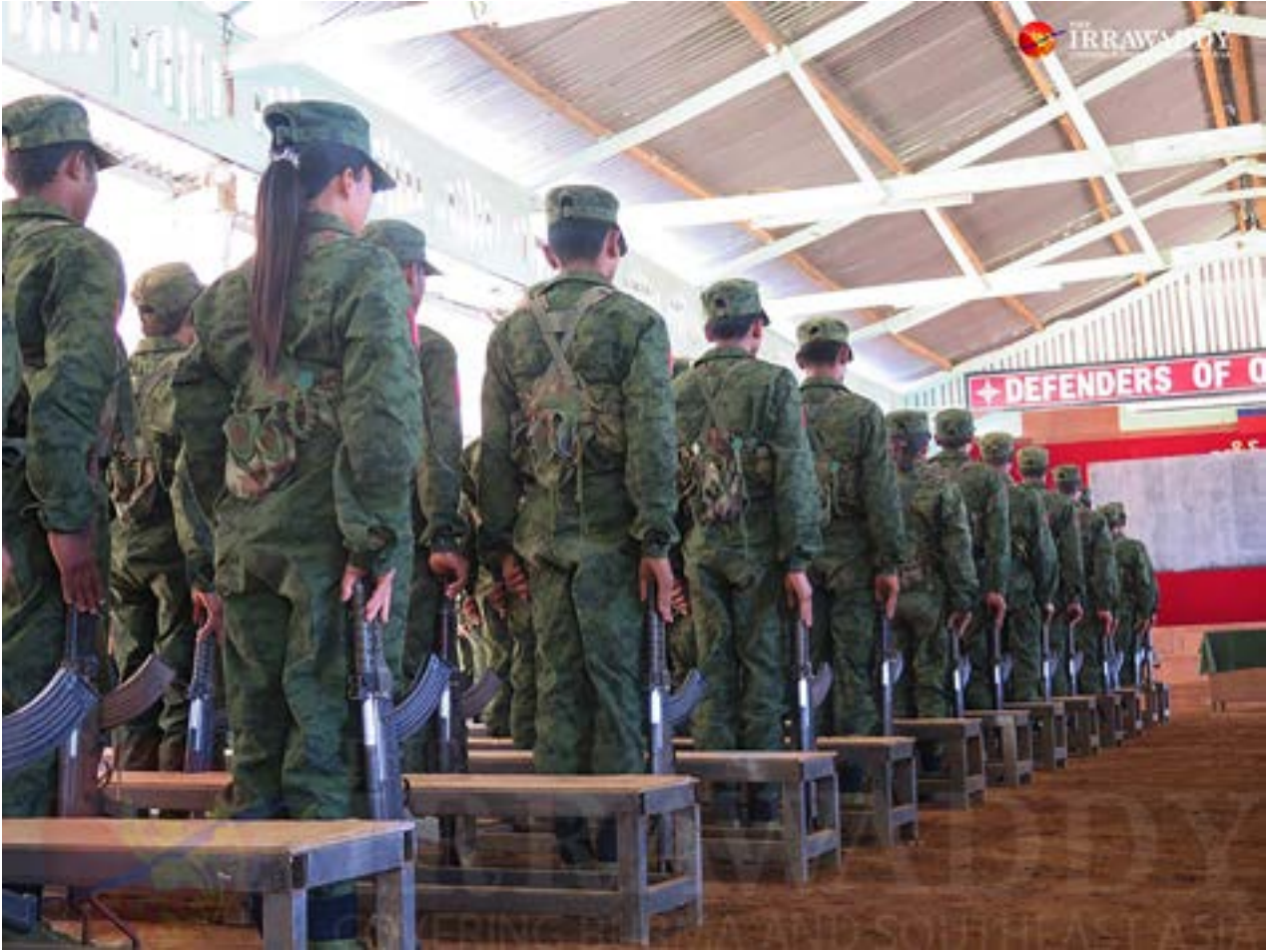
သင်တန်းတစ်ခုတွင်တွေ့ရသော AA တပ်ဖွဲ့ဝင်များ။