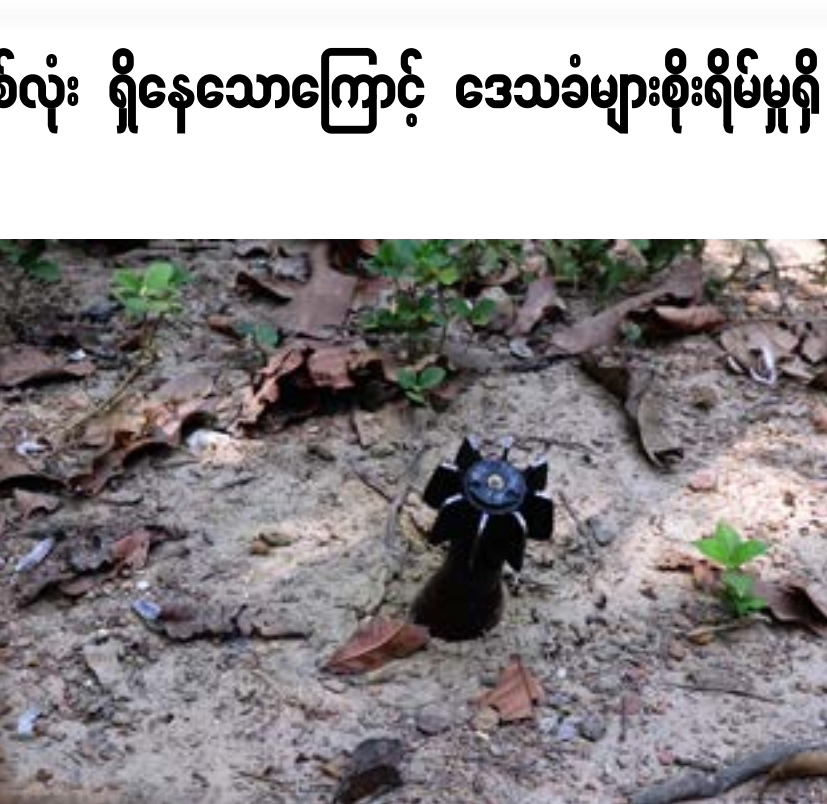
ဘူးသီးတောင်မြို့နယ် စည်တောင်ကျေးရွာအတွင်း ကျရောက်ပြီး မပေါက်ကွဲသေးသော လက် နက်ကြီးကျည်တစ်ခုအား ဧပြီလအတွင်းက တွေ့ရစဉ်။