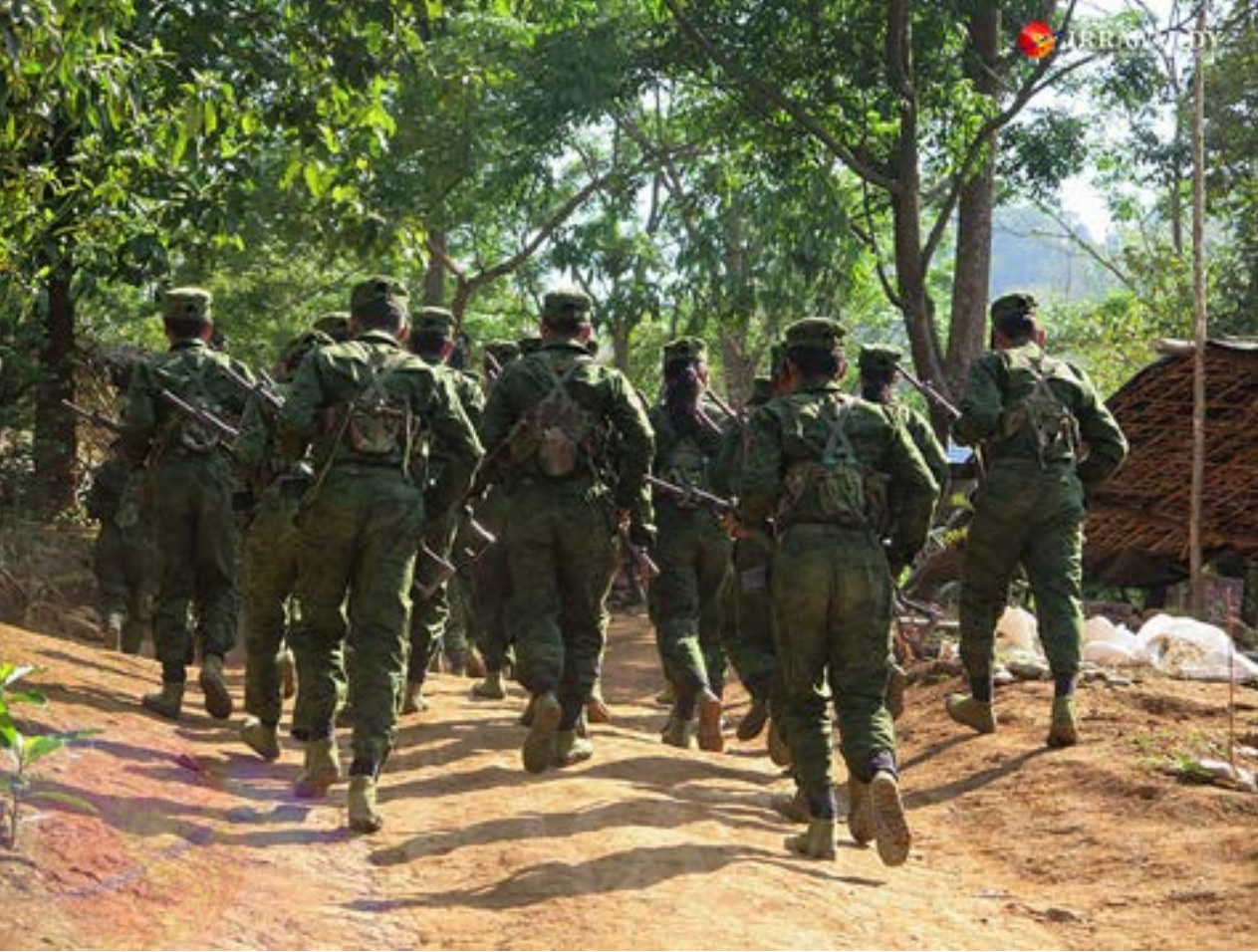
စစ်ရေးလေ့ကျင့်နေသော AA တပ်ဖွဲ့ဝင်များ။

လာဖို့အတွက် အရေးကြီးဆုံး အခန်းကဏ္ဍမှာရှိခဲ့ပြီး ဒီနေ့အထိလည်း ထောင်နဲ့ချီတဲ့ AA ရဲဘော်တွေနဲ့ သီးသန့်ရွေးတဲ့ပြီး ရခိုင်ရဲဘော်တချို့ အာဟာရချို့အရာရှိတွေ မှေးထုတ်နိုင်ဖို့ကို ကူညီပေးနေတယ်လို့ သိရပါတယ်။