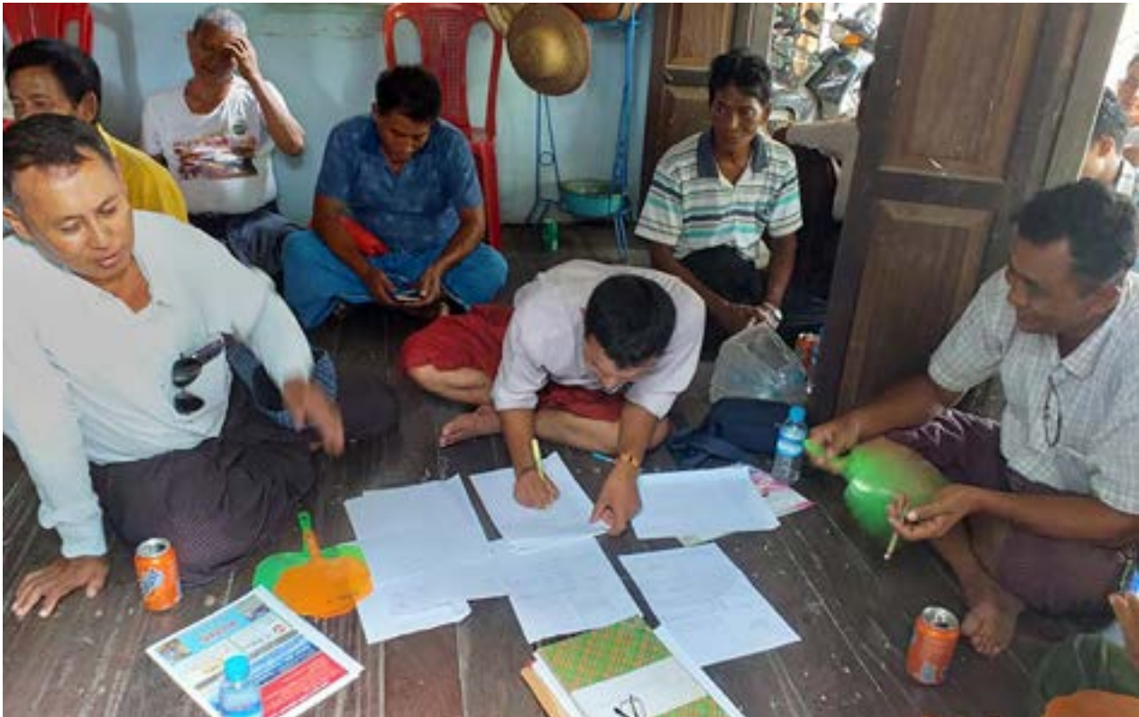
နှုတ်ထွက်စာ တင်နေကြသည့် မာန်အောင်မြို့နယ်က ပါတီဝင်များကို တွေ့ရရည်။

မင်းထွန်း ပြည်နယ်အတွင်း အင်အားကြီး ပါတီဖြစ်သည့် ရခိုင်အမျိုးသားပါတီ (ANP)သည် မာန်အောင်မြို့နယ်က ပါတီ ဗဟိုကော်မတီဝင်တစ်ဦးကို ထုတ်ပယ်လိုက်ပြီးနောက် ကျန်မြို့နယ်အမှု