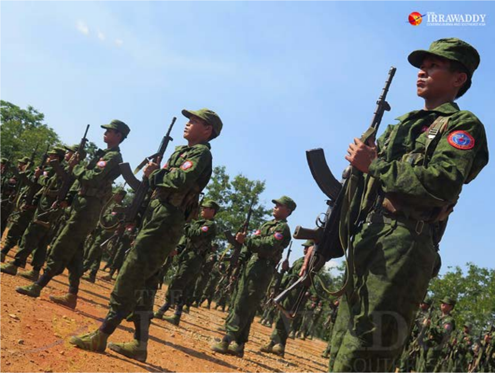
စစ်ရေးလေ့ကျင့်နေသော AA တပ်ဖွဲ့ဝင်များ။

ဆယ်တန်းအောင်တော့ ဆေးကျောင်းအမှတ်မီတာကြောင့် ရခိုင်ကနေ