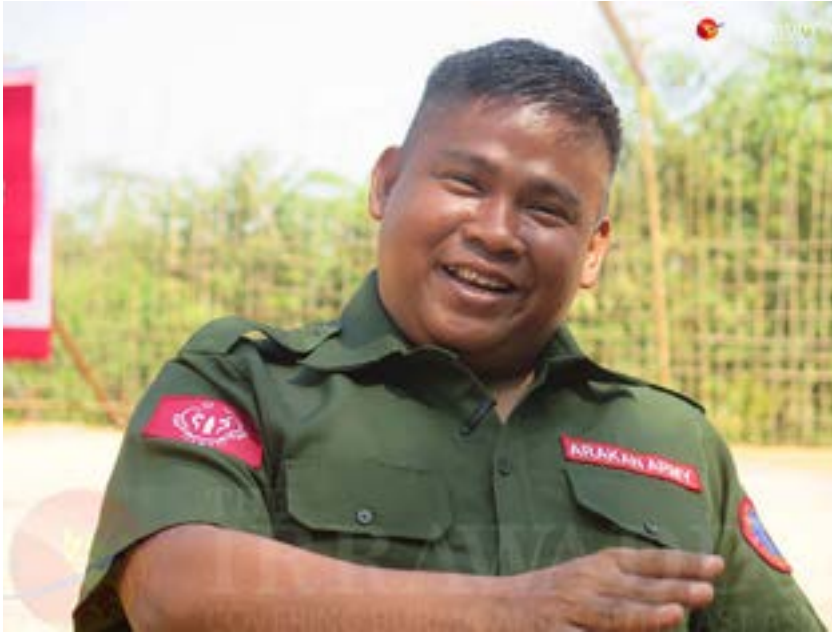
AA ဒုတိယ စစ်ဦးစီးချုပ် ခိုလ်မှူးချုပ် ညိုထွန်းအောင်

အသက်ပေးသွားရတာမျိုးလည်း ရှိတယ်လို့ သိရပါတယ်။