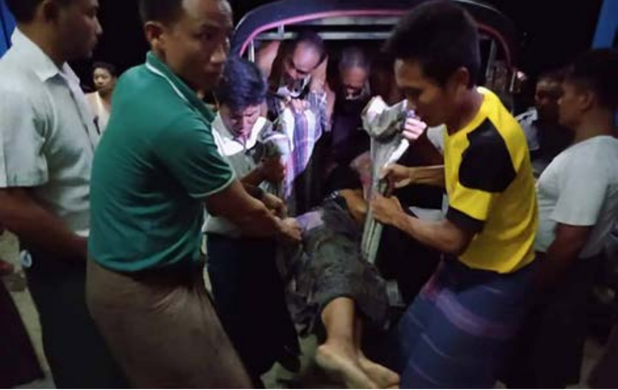
ဂဏန်းမဲရွာမှ ဒဏ်ရာရရှိသူများအား စစ်တွေဆေးရုံသို့ သယ်ဆောင်လာစဉ်။

အလားတူ မြောက်ဦးမြို့နယ်၊ ဝေသာလီကျေးရွာတွင်လည်း ကျည်ဆန်ထိမှန်မှုကြောင့် အသက် (၆၀)